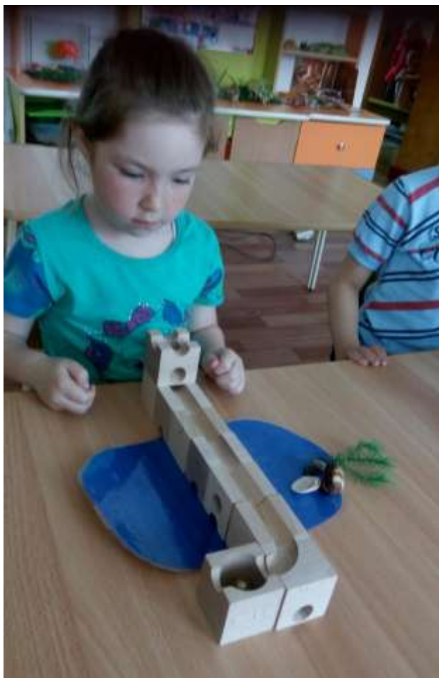
«Мост через реку» (использование желобка)